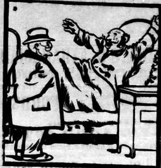
— Cum, adică, s-a căsătorit cu methilic, mori? — Nui Mai întâi orbești...